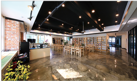
주민 모임터 '마실' 주민 자율 공간·공연 체험·프로그램