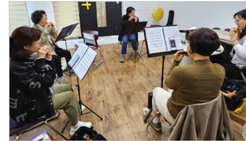
'심' 동호회 및 음악활동공간