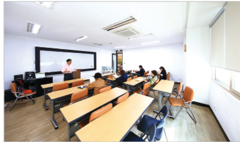
'채움' 동호회 및 교육, 회의공간