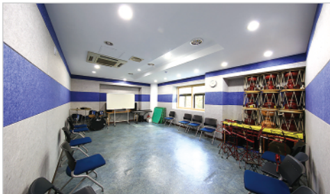
'이음' 동호회 및 악기연주공간